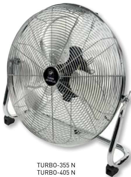
TURBO-355 N TURBO-405 N TURBO-455 N PLUS