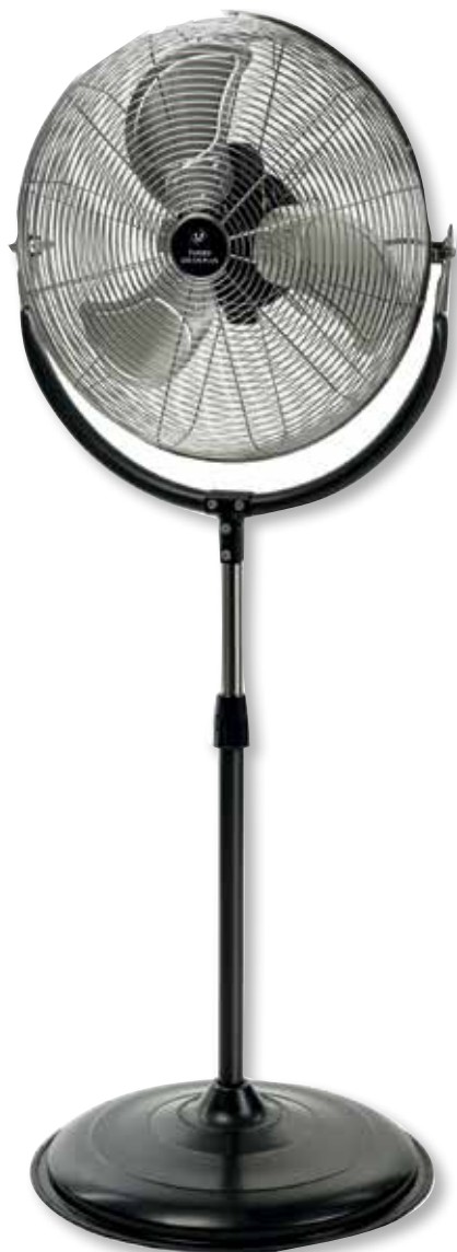
TURBO-455 CN PLUS