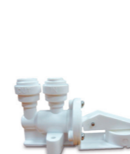
Water Stop 3/8''